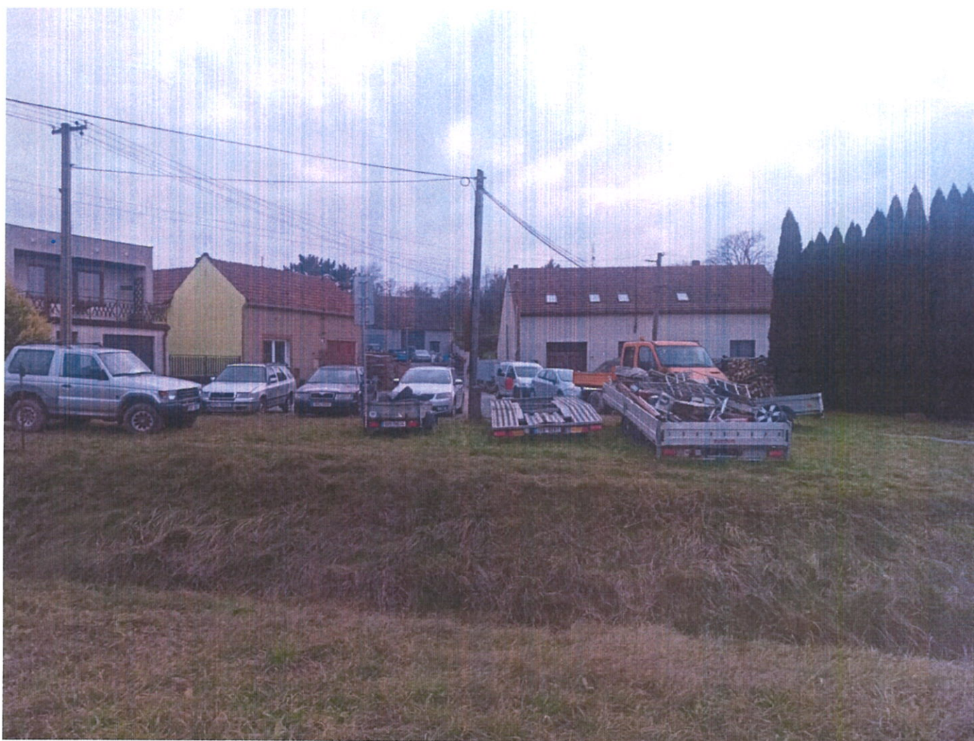
Obrázek 6 všechny vozíky z dálky