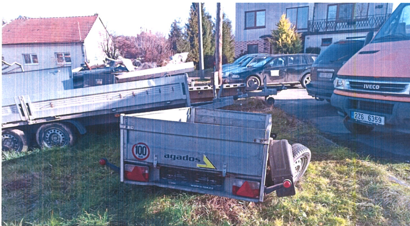
Obrázek 1 Vozík č.1