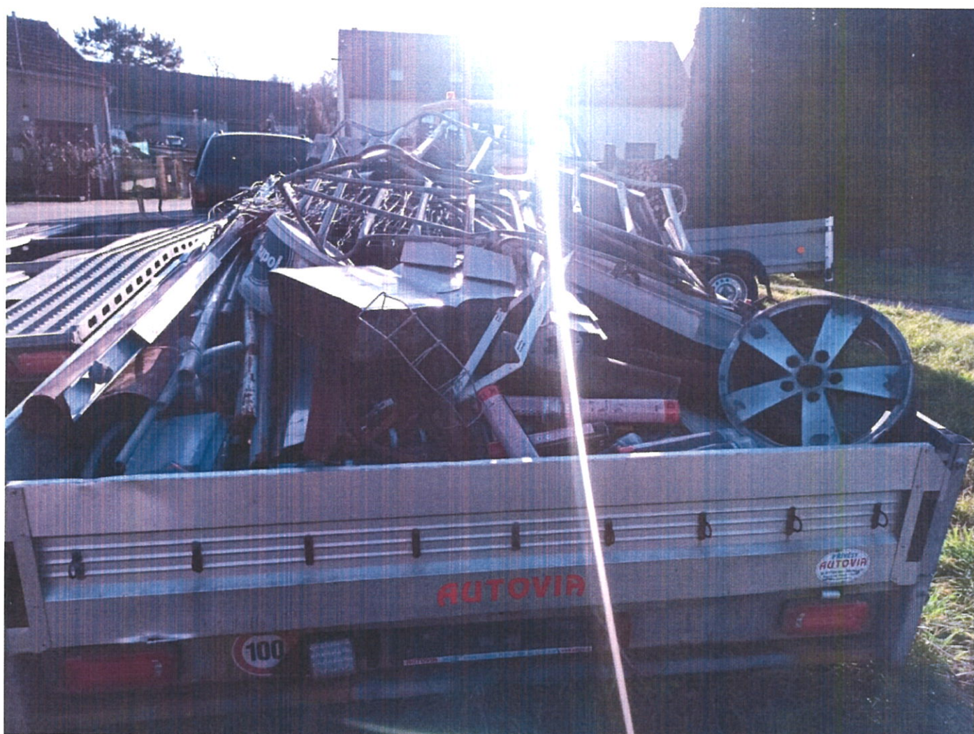
Obrázek 2 vozík č.2