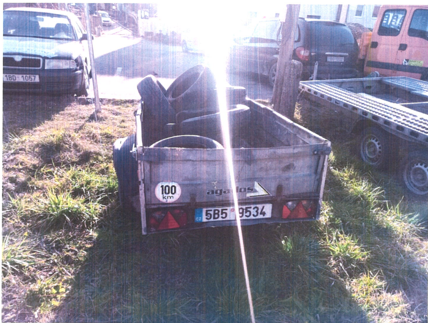
Obrázek 4 Vozík č.4