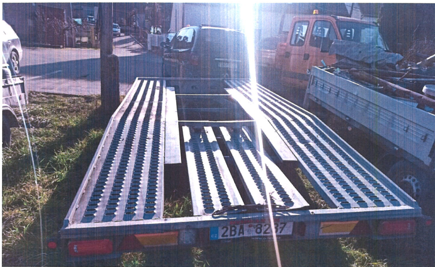
Obrázek 3 podvalník-vozik č.3