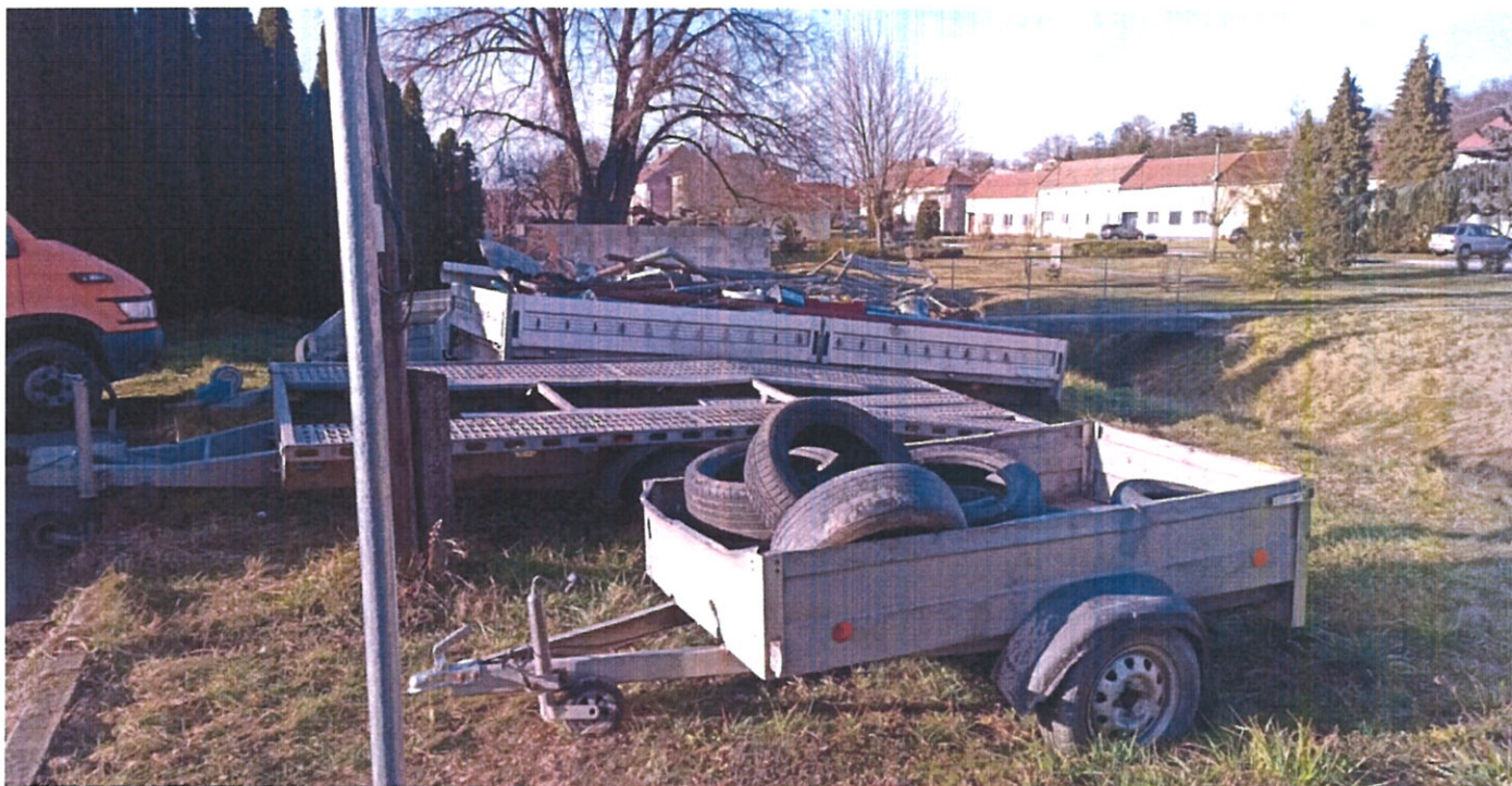
Obrázek 5 vozíky na veřejném prostranství