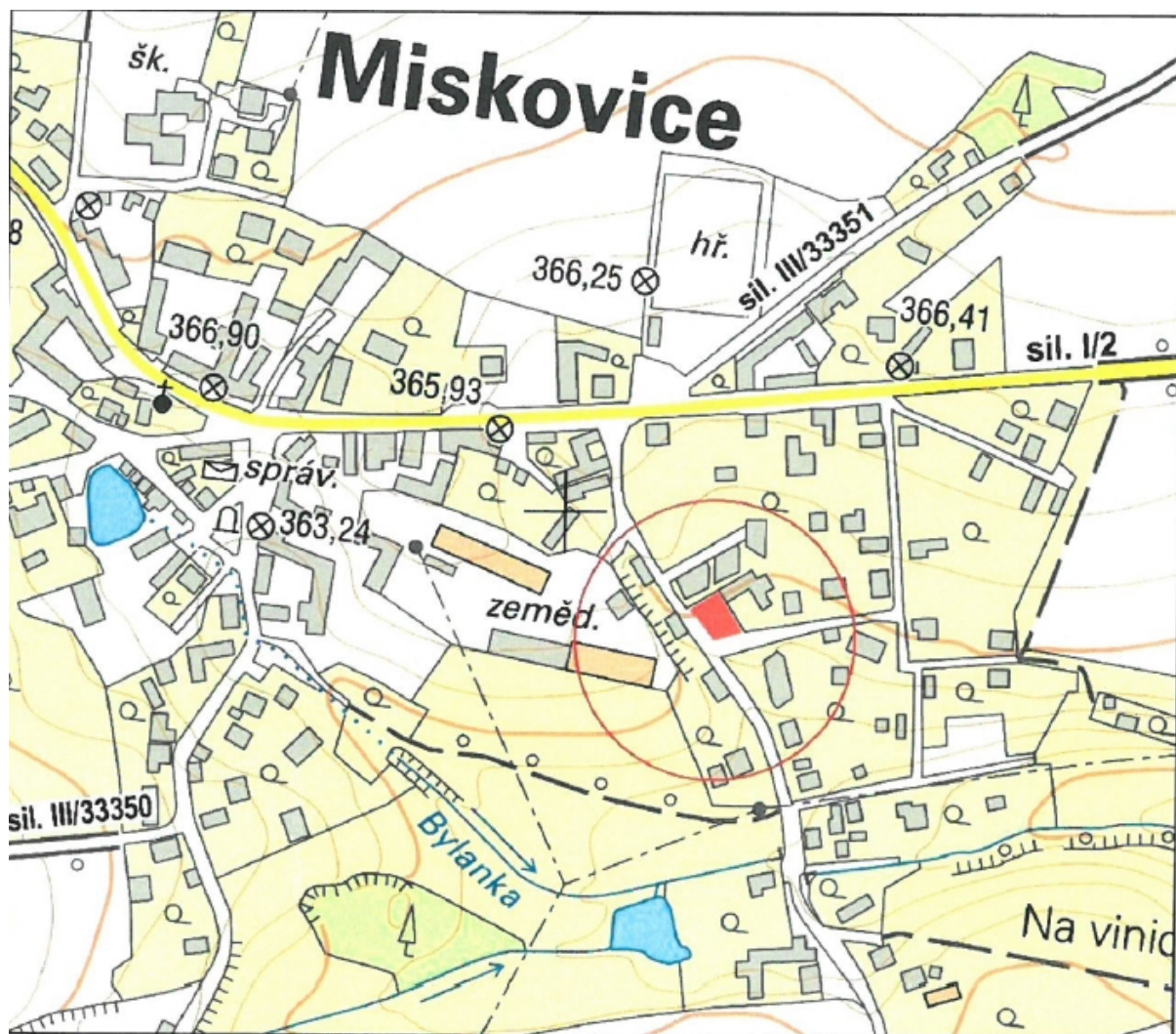
Veřejné parkoviště na pozemku 158/6 v Miskovicích