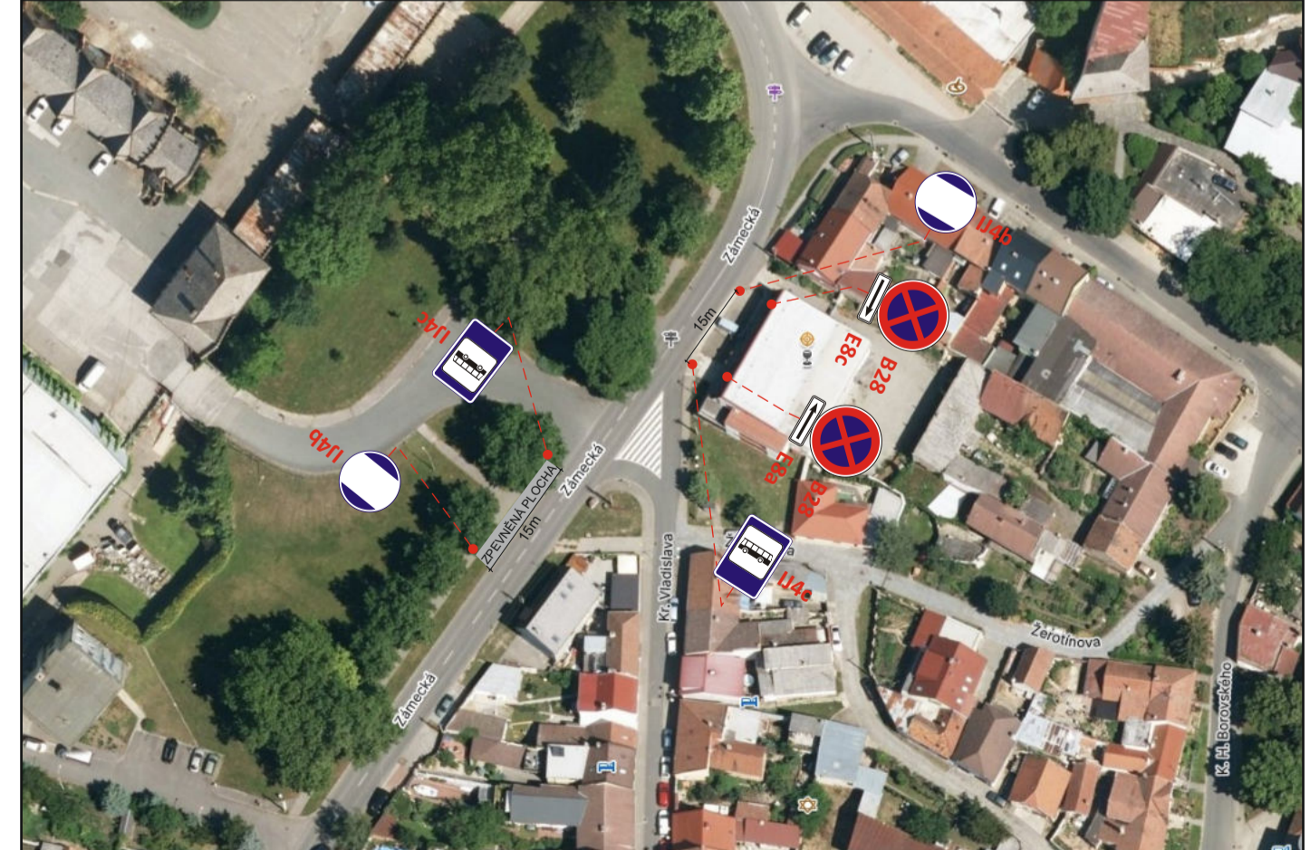
DETAIL PŘESUNU ZASTÁVKY - BZENEC NÁM.

POTVRZENÍ PLATNOSTI DOKUMENTACE: POLICIE ČESKÉ REPUBLIKY - DOPRAVNÍ INSPEKTORÁT HODONÍN: