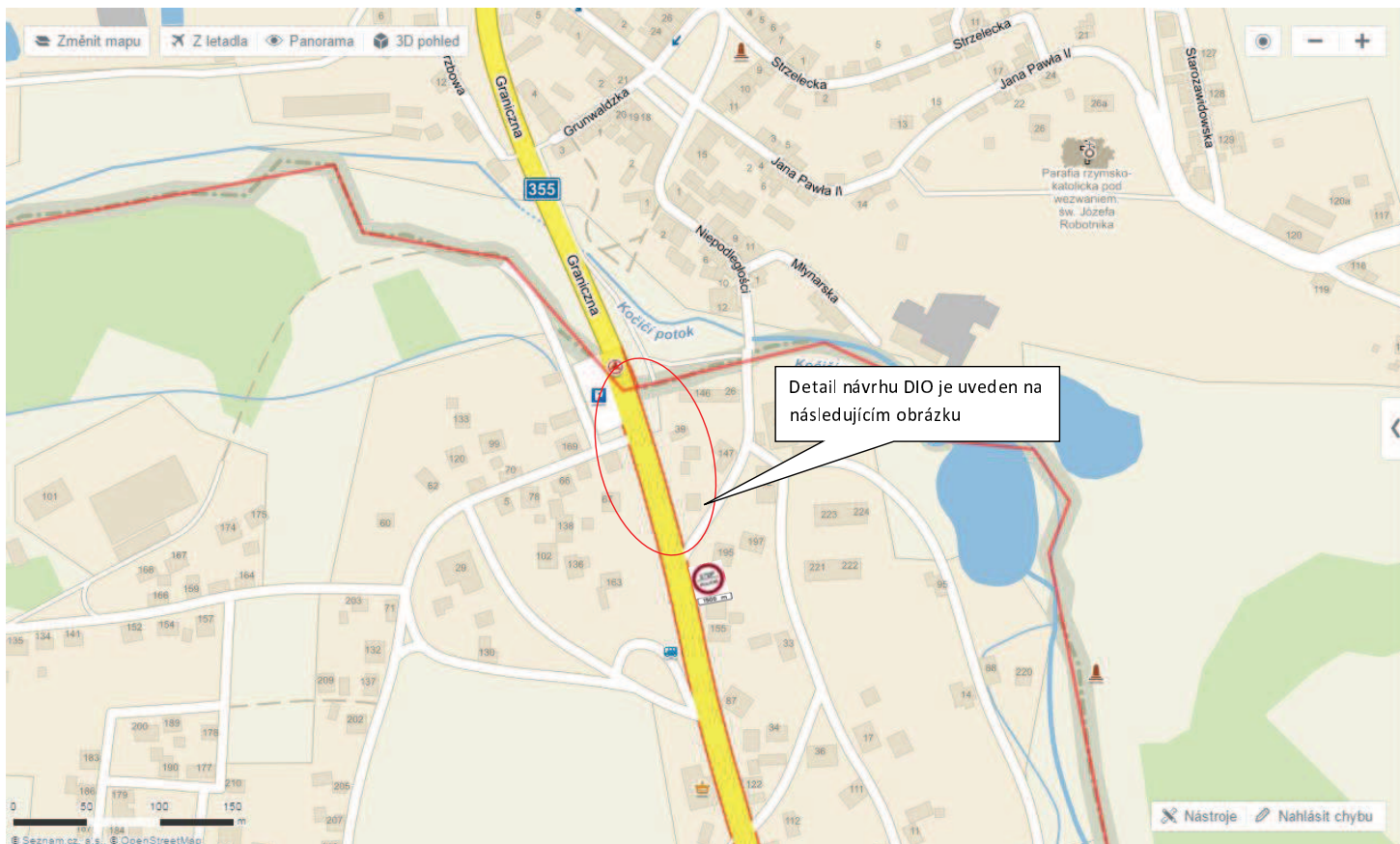
Návrh instalace přechodného dopravního značení B27 stop policie + E3a