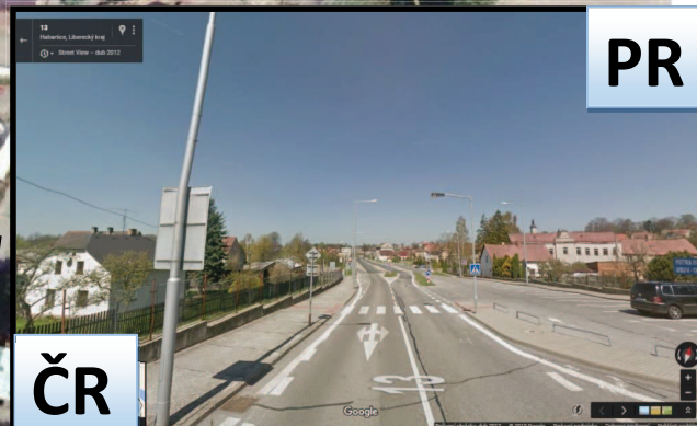
Pohled na hraniční přechod Habartice - Zawidów