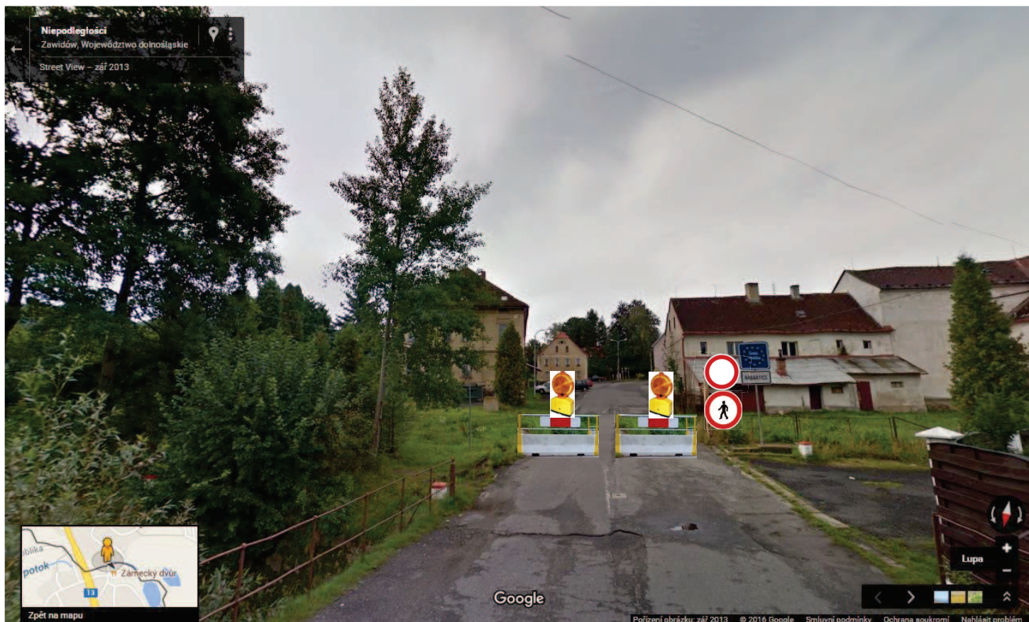
Pohled na hraniční přechod Habartice ve směru od Polské republiky – návrh dopravního značení B1 „zákaz vjezdu všem vozidlům“ a betonového svodidla a B 30 Zákaz vstupu chodců a Z2