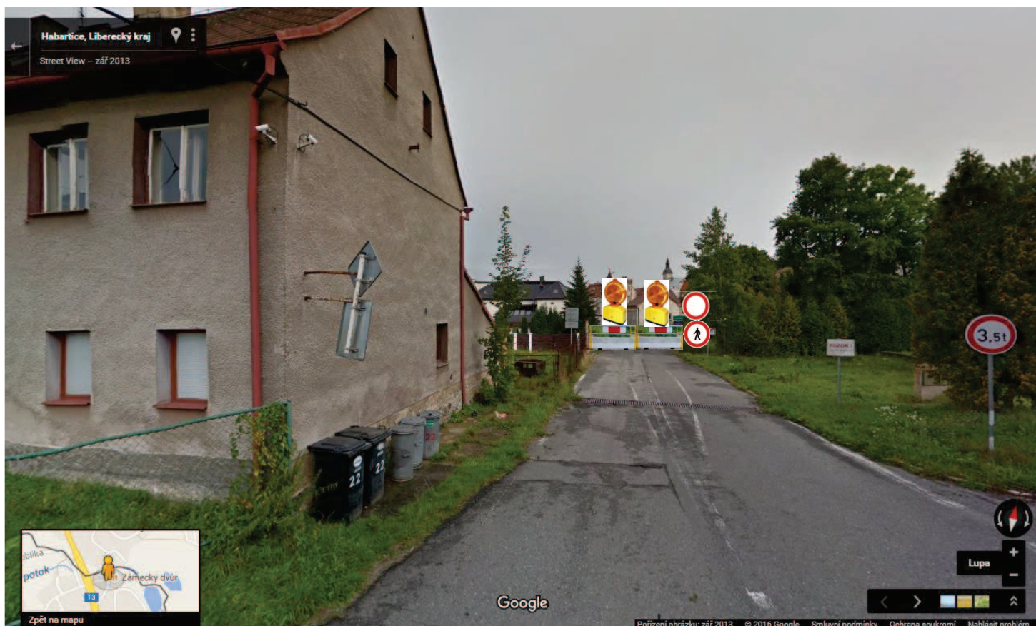
Pohled na hraniční přechod Habartice ve směru od České republiky – návrh dopravního značení B1 „zákaz vjezdu všem vozidlům“ a betonového svodidla a B 30 Zákaz vstupu chodců a Z2