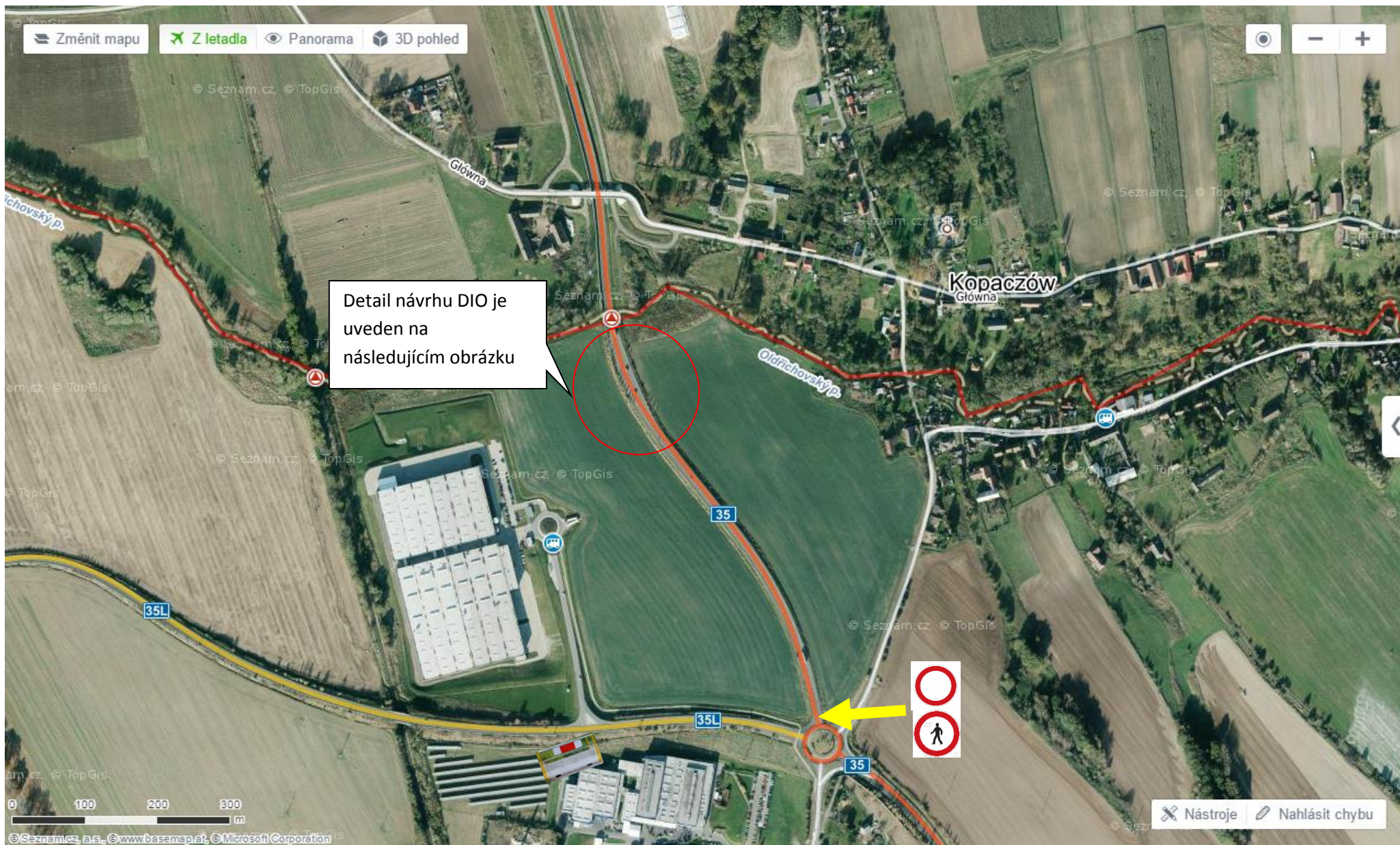
Návrh přechodného dopravního značení č. B1 a č. B30 na začátku větve okružní křižovatky silnice I/35 směr Polská republiky.