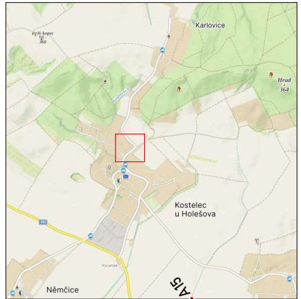
pracovní místo v úseku mimo křižovatky

stávající DZ B20a na konci obce Karlovice