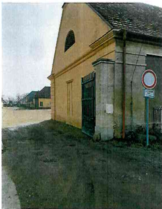
Příloha č. 3 – fotodokumentace stávajícího stavu.