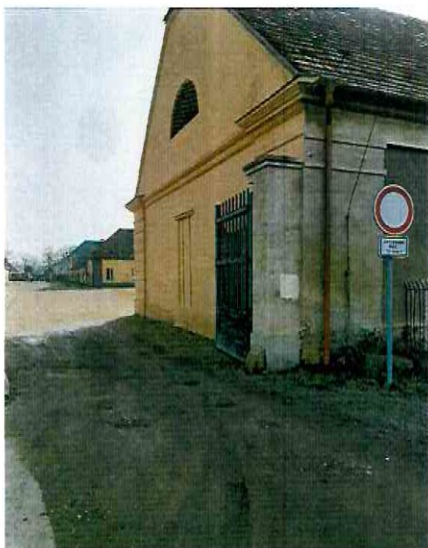
Příloha č. 3 – fotodokumentace stávajícího stavu.